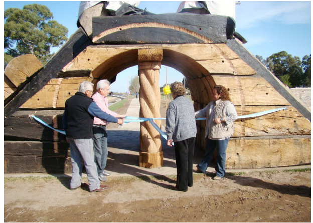
El corte de cintas simbólico en el Portal de Acceso al Paseo del Lago.

Luego el propio Intendente Municipal dejó unas palabras antes de dar paso a la bendición y corte de cinta tradicional, en su mensaje destacó que se estaba dando un paso fundamental y se saldaba de esa forma una deuda con todos los salliquelenses, la de poder tener en nuestra comunidad un espacio verde que permitiera disfrutar de la natu-